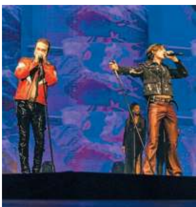
di Patrizio Ruvigliani ● a pagina 13