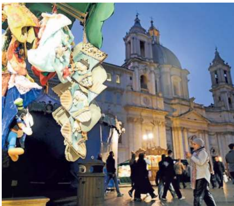
▲ I banchi Le bancarelle montate ieri sera per la festa delle Befana