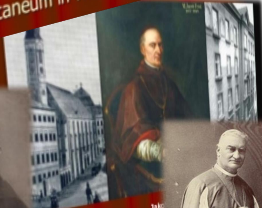
Jako Initiator un