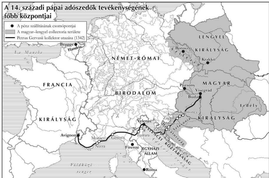
1. térkép